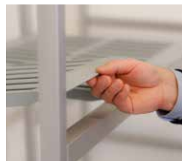
položte plastové výplně