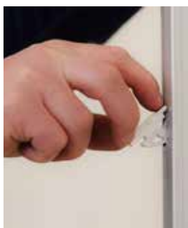
vložte háček do stojiny