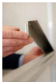
položte rohovou spojku, pokud stavíte rohový regál