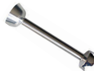
XL Mixovací tyč