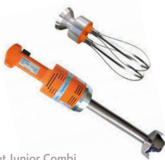
Set Junior Combi