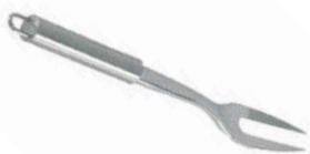
Vidlice na maso