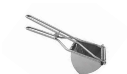
Lis na brambory