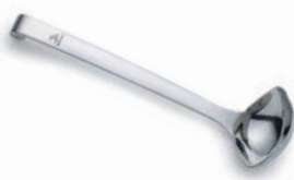
Naběračka na omastek