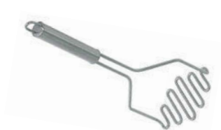
Šťouchadlo na brambory