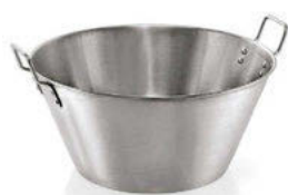
Mísa s úchyty