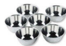
Misky nerezové/set 6 ks