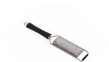
Struhadlo/perforace 2 mm