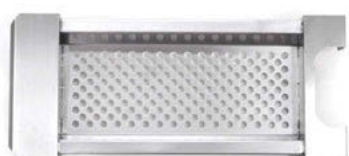
Síto na játrovou rýži

Nepostradatelný pomocník do každého provozu pro přípravu halušek či játrové rýže. Vysoká kvalita zpracování, vhodné do všech provozů. Je možné vyrobit síto na požadovaný průměr hrnce nebo kotle, dle vašich preferencí.