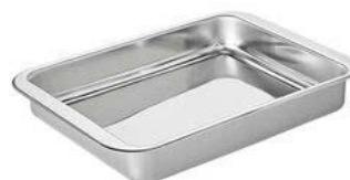
Mísa na maso