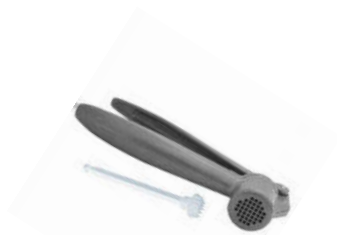
Lis na česnek