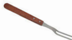
Vidlice na maso