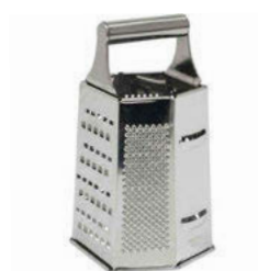
Struhadlo 6 hran