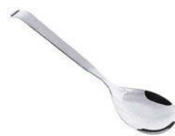
Lžice servírovací nerez