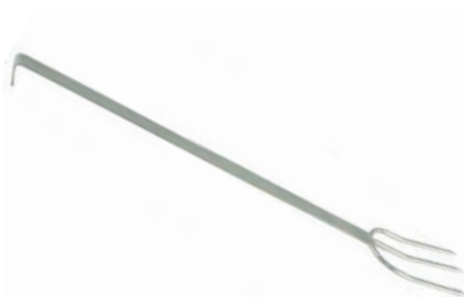
Vidlice na maso