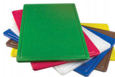
Desky barevné s drážkou