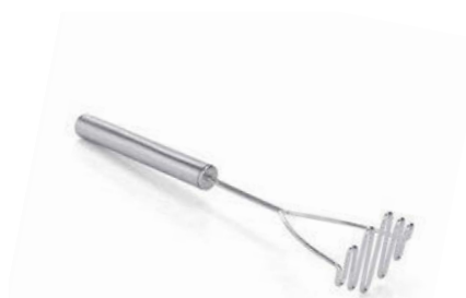
Šťouchadlo na brambory