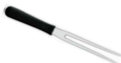
Vidlice na maso