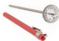
Teploměr vpichový analogový