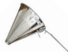
Cedník špičák pocínovaný