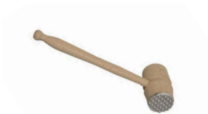
Palička na maso