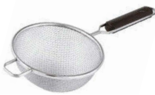
Cedníkové síto hrubé

jemné síťování, široký okraj, velikost otvorů 0,5 mm