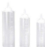
Dávkovač na omáčky transparentní