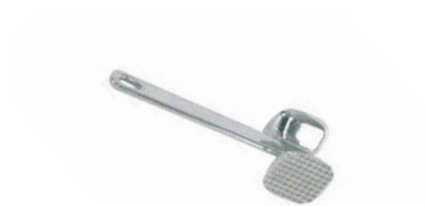
Palička na maso