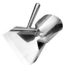
Lopátka na vkládání hranolků