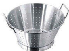
Odkapávač s prstencem