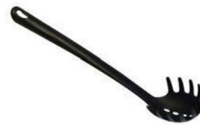
Lžíce na špagety