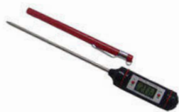
Teploměr vpichový digitální