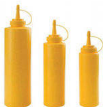
Dávkovač na omáčky žlutý