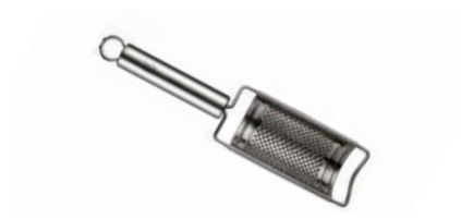
Struhadlo na citrusy