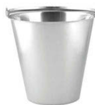
Vědro bez prstence