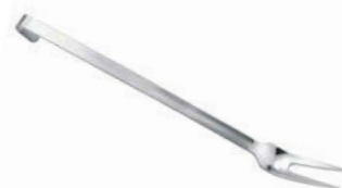
Vidlice na maso