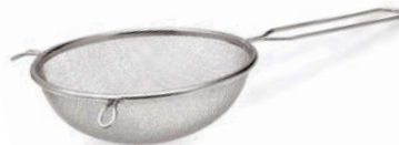
Pasírovací síto hrubé