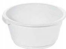
Mísa plastová se zapuštěným úchytem