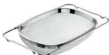
Síto na džez

rukojeř dřevo, dvojitě síto průměr otvorů 2 mm a 4,5 mm, cínová ocel