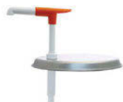
Pumpička s krytem na kbelík