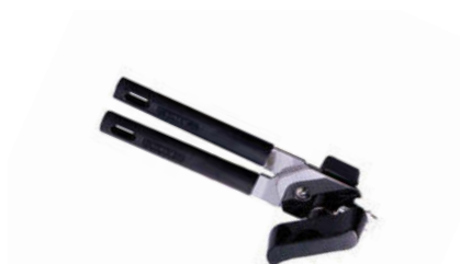
Otvírák na konzervu ruční