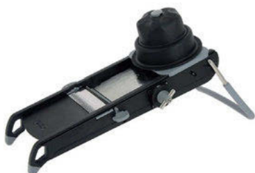
Mandolína Swing Plus

Mandoliny deBuyer jsou profesionální nástroje sloužící k rychlému, snadnému a bezpečnému krájení zejména zeleniny, ale i uzenin a ovoce. Bezpečnost použití zajišťují kloboučky, nedochází k přímému kontaktu těla s noži. Rychlost a přesnost zajišťují precizní nože. V naší nabídce máme nerezové i plastové mandoliny. Dělí se podle vybavení, velikosti a materiálu. Nejjednodušší a zároveň nejoblíbenější model je mandolína Kobra.