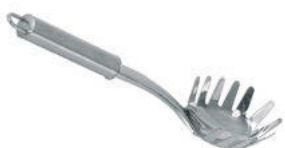
Lžice na špagety