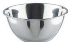
Mísa vysoká leštěná