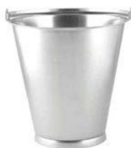
Vědro s prstencem

plastové provedení, se sítkem, různé barevné provedení dle nabídky