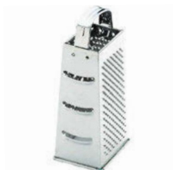
Struhadlo 4 hrany