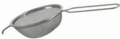
Cedníkové síto jemné