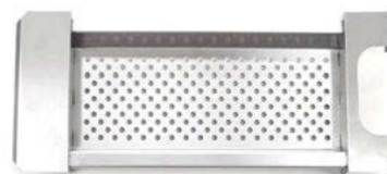
Síto na halušky

nerezové provedení, průměr perforace 7 mm, na objednávku možný i jiný rozměr