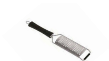
Struhadlo/perforace 4 mm