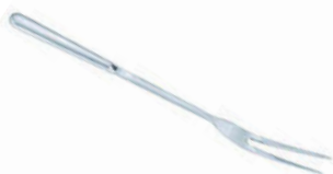
Vidlice na maso