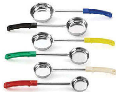
Naběračka plochá roztírací