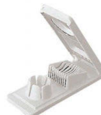
Kráječ vajec měšičky