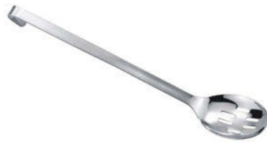
Lžíce servírovací perforovaná