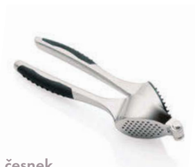
Lis na česnek