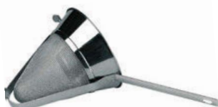
Síto bujón konické