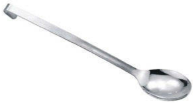
Lžíce servírovací plná