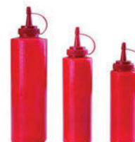
Dávkovač na omáčky červený