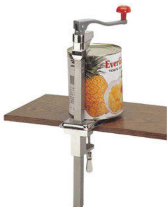
Otvírák na konzervu stolní