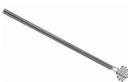
Šťouchadlo na brambory