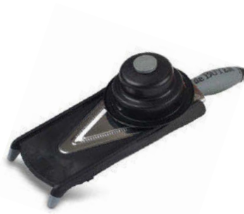
Mandolína Kobra V-Axis