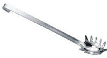
Lžice na špagety