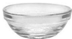
Mísy a misky skleněné stohovatelné