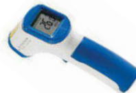
Teploměr bezkontaktní laserový