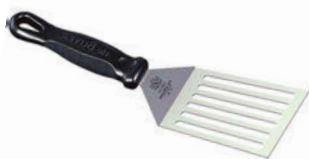
Špachtle perforovaná FKOfficeum