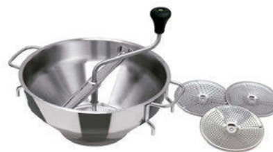
Pasírka Jumbo na hrnec