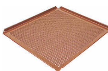
Plech na pečení Al non-stick