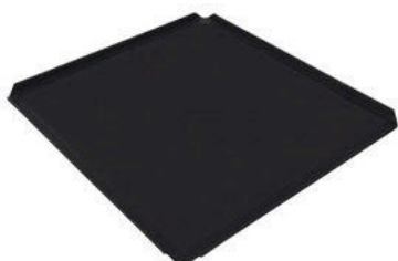
Plech TYNECK s otevřenými rohy