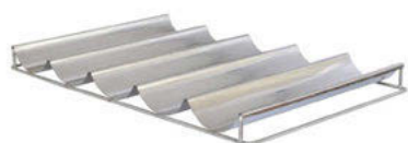
Rošt na knedlíky 18/10