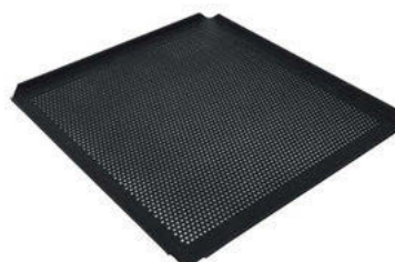
Plech TYNECK s otevřenými rohy perforovaný