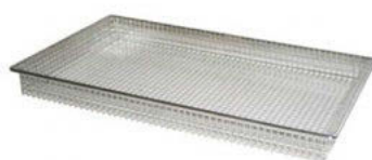
Koš fritovací 18/10