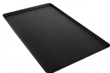
Plech TYNECK s kulatými rohy